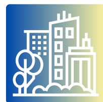
城市发展与 环境管理